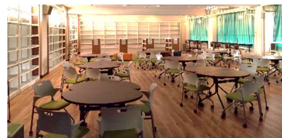
イメージ 共同研究ラボ