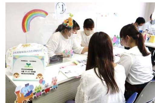
幼稚園フェアでの就職相談（イメージ）