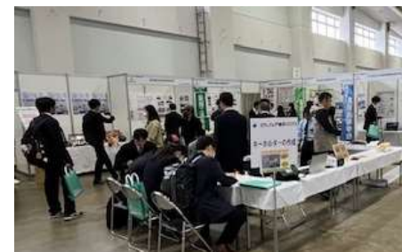
イメージ 進学フェア