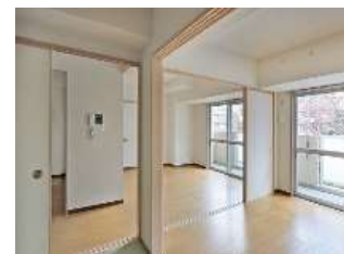
子育て世帯向け リノベーション グレードアップ改修