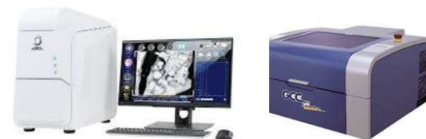
卓上走査電子顕微鏡