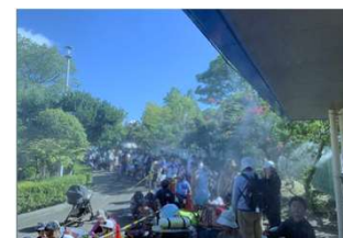
ミストのイメージ